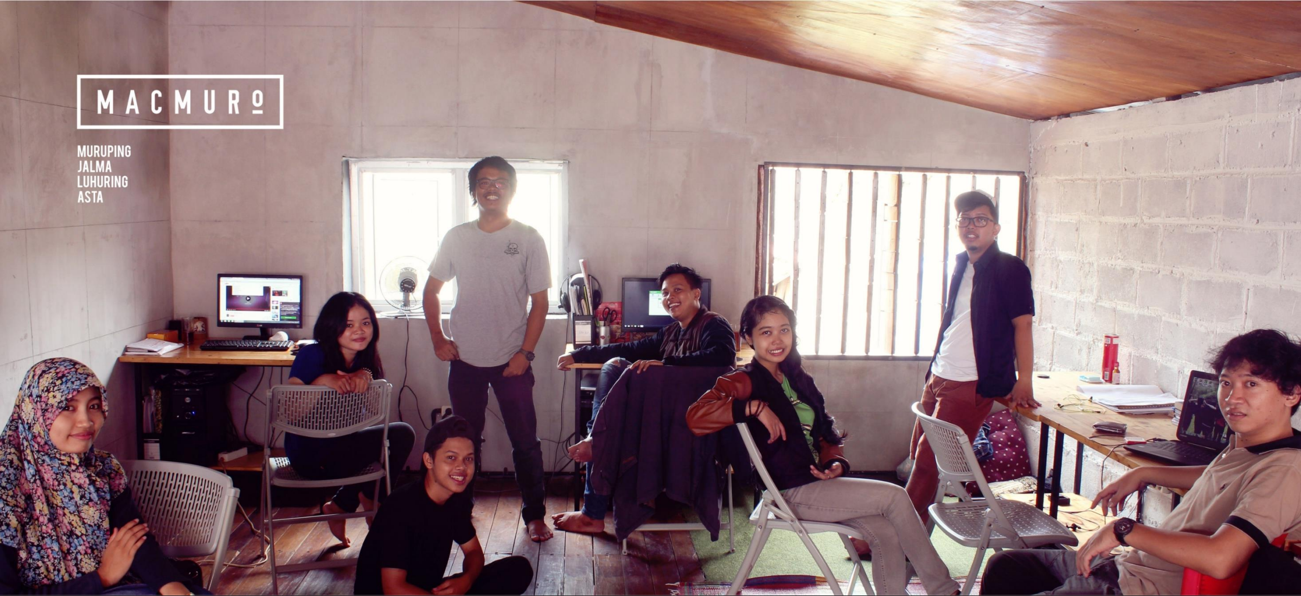
THE MACMUR FAMILY